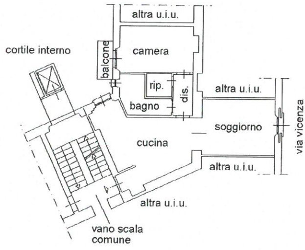
Pianta piano terzo h = 2.90 m.